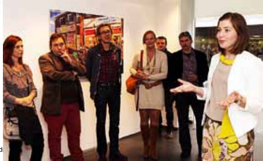
Co-creaties leiden tot nieuwe winkelconcepten

20-jarige galeriehoofd Amsterdam en Mijne Kuepers Art wil naar een plan met een markt opbouw. Het is leuk om te zien. Het is leuk om te zien. Het is leuk om te zien.