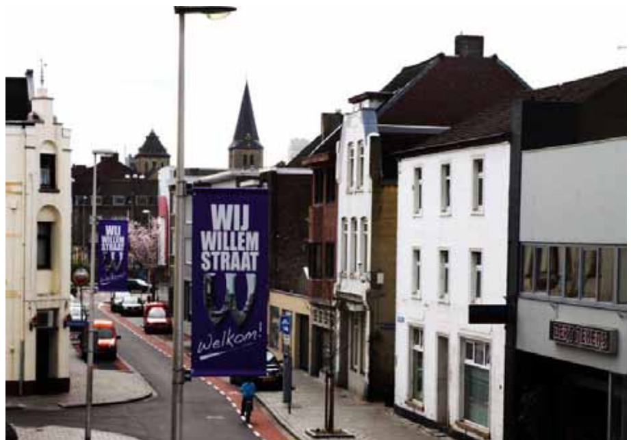
Straataanpak Willemstraat 'Wij Willemstraat'.

Het pilot-project heeft aan nieuwe inzichten en goede ontwikkelingen bijgedragen. Het pilot-project heeft betrokken pandeigenaren wakker geschud en bewust gemaakt. Tevens heeft het pilot-project bijgedragen aan een breder draagvlak voor de aanpak van leegstand/leefbaarheid in Heerlen. Mede door het pilot-project zijn er door Urban Ads middels unieke co-creaties (Woonpunt, Weller, Provincie Limburg, gemeente Heerlen en met betrokken pandeigenaren), acht nieuwe winkelconcepten gerealiseerd in voormalige leegstaande panden, waaronder vier winkelconcepten in Heerlen (een viswinkel, een bakkerij, een sportschool en recent een commerciële galerie (in een van de drie voormalige pilot-panden).