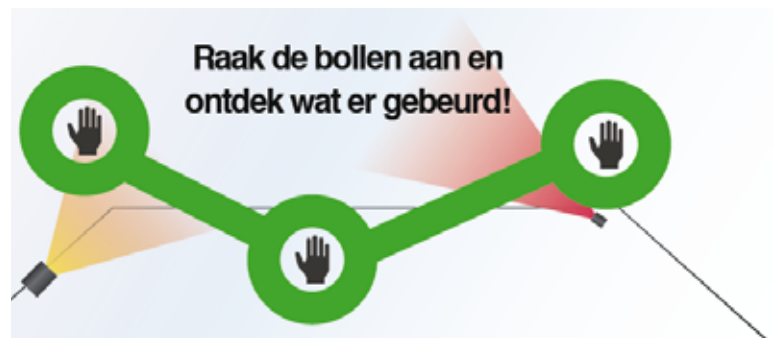
Interactieve experimenten Noos Design.

In de Oranje Nassaustraat is een jaar lang i.s.m. Noos Design geëxperimenteerd met interactieve presentaties. De banieren werden bijvoorbeeld aangelicht door lampen die reageren op beweging van voorbijgangers. Middels computers, censoren en speciaal ontwikkelde software zijn meerdere interactieve presentaties gerealiseerd. Ook is er geëxperimenteerd met bewegende informatie dragers, die middels computers en censoren reageerden op voorbijgangers. Voor de Foto campagne ENGAGE-project zijn de ontwerpen van de poster campagne omgezet naar de banieren.