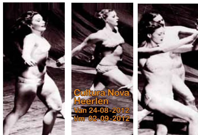
Cultura Nova Heerlen Van 24-08-2012 t/m 02-09-2012