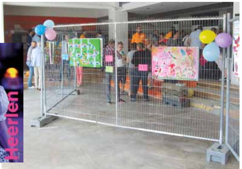
Expositie amateurfotografie en kindertekeningen Cultura Nova.