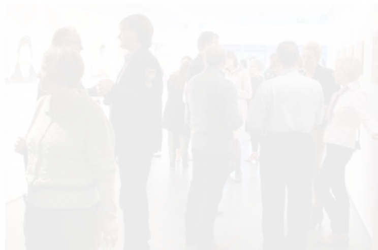
donderdag, 08 februari 2013