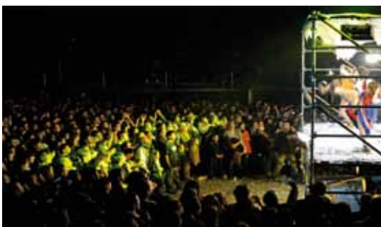
Foto expositie en banieren Cultura Nova.

De panden zijn verder aangekleed met grootformaat posters, schilderijen, canvassen en met spullen die te leen werden aangeboden door bijvoorbeeld Kasteel Hoensbroek, Historisch Goud, gemeente Heerlen en Cultura Nova.