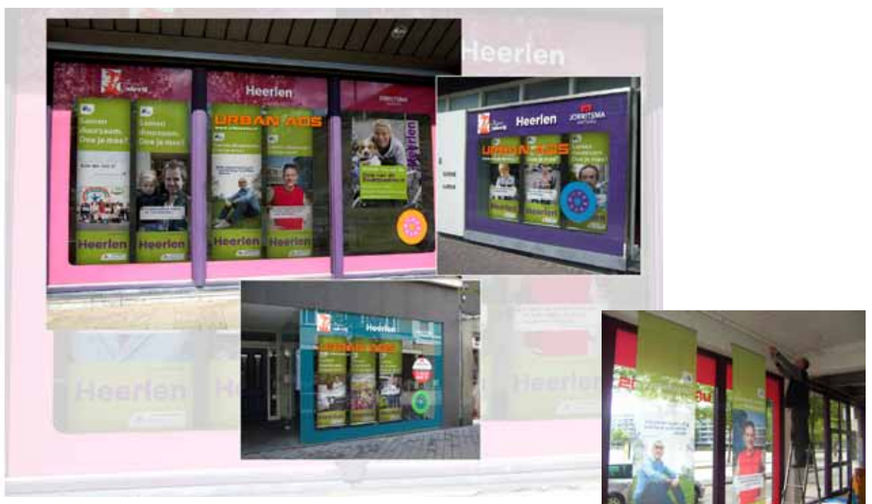
Foto campagne ENGAGE-project.

Stichting URBAN ADS (043 246 0017) - Naam van de Urban Ads: URBAN ADS (043 246 0017) - Stichting URBAN ADS Tel: 043 246 0017 - www.urbandads.nl - www.heerlen.nl