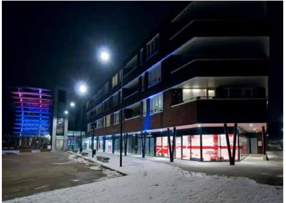
Sportschool Heerlerheide i.s.m. Weller en Team Thriving.