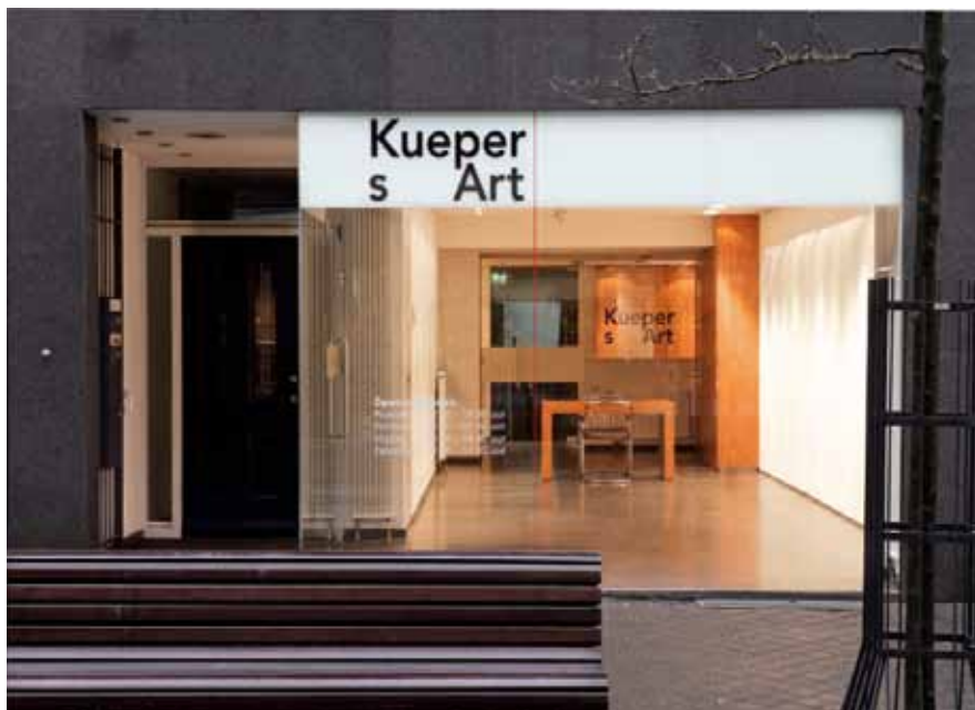
Kueperst Art, Oranje Nassaustraat 25 (in voormalig pilot-pand).