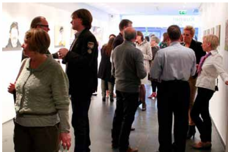
donderdag, 28 februari 2013