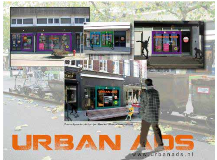
Posterpresentatie pilot-project Heerlen centrum.