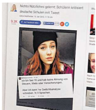
12 000 Mal geteilt und 21 000 Mal favorisiert: der Tweet der 17-Jährigen aus Köln.